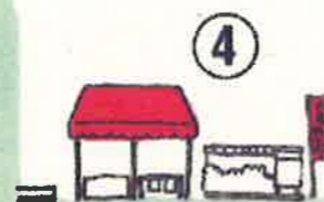
中国銀行前駐車場