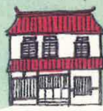
やかげ町家交流館